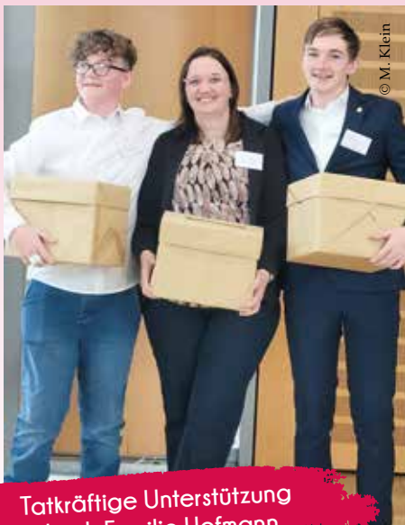
Tatkräftige Unterstützung durch Familie Hofmann