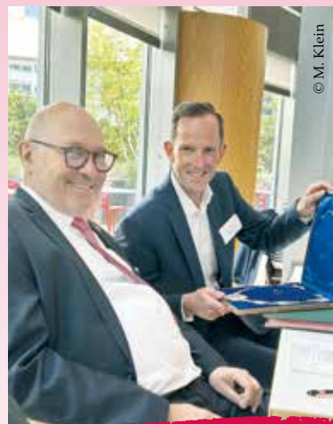
Die Kette des Präsidenten hat einen neuen Besitzer